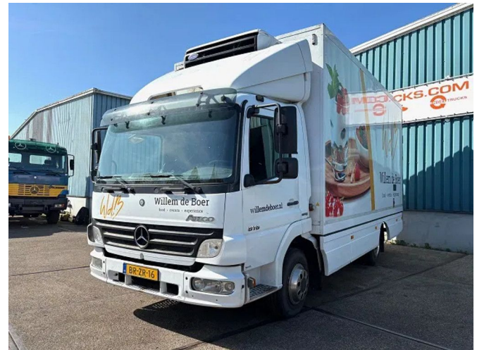
Mercedes-Benz Atego 816 L 4x2 ORIGINAL DUTCH COOLE...