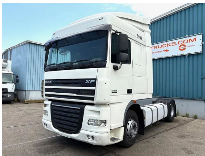
DAF XF 105.460 SPACECAB (ZF16 MANUAL GEARB... 4x2