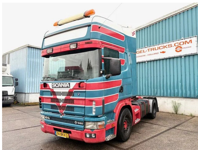
Scania R164-580 V8 TOPLINE COLLECTORS ITEM!! / ... 4x2