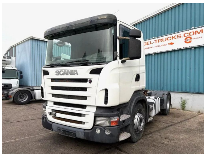
Scania R380 LA 4x2 DAYCAB (EURO 3 / 12 GEARS MANUA...